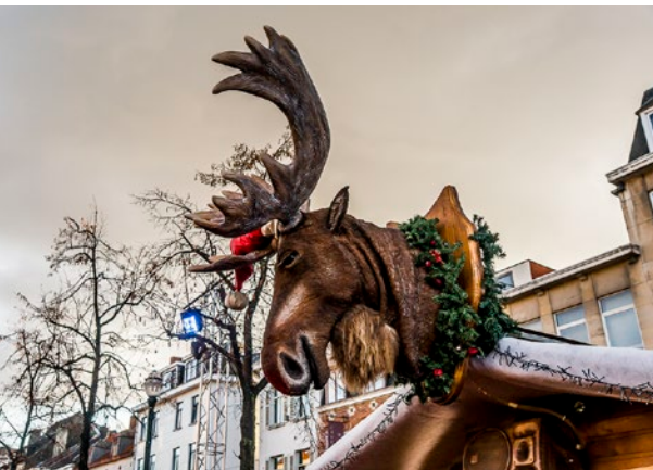
▲ Рождественские рынки в европейских городах работают с конца ноября по конец декабря

ТАК ЧТО 25 И 26 ДЕКАБРЯ ВЫ, ОКАЗАВШИСЬ В ЕВРОПЕ, ЗАСТАНЕТЕ ПУСТЫЕ УЛИЦЫ, НЕРАБОТАЮЩИЙ ТРАНСПОРТ И ЗАКРЫТЫЕ МАГАЗИНЫ. ЭТИ ДНИ ЛУЧШЕ ПРОВОДИТЬ ИЛИ ДОМА, ИЛИ В ДОРОГЕ ТУДА, ГДЕ ВЫ СОБИРАЕТЕСЬ ВСТРЕЧАТЬ НОВЫЙ ГОД.